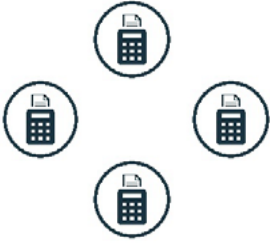
Yeni Nesil ÖKC

ÖKC TSM Merkezleri, yeni nesil ÖKC'ler ile gerçekleştirilen işlemlere ilişkin mesajların GİB bilgi sistemlerine ve üye iş yeri anlaşması yapan kuruluşlara belirlenen iletişim protokolleri çerçevesinde aktarımını sağlamaktadır.